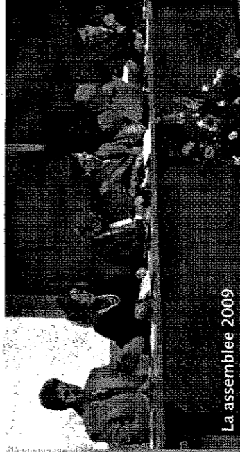
La assemblee 2009